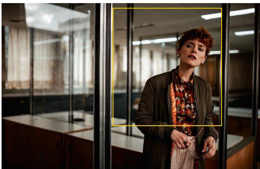
Исходный кадр с зоной ROI

Параметр “roi” (конфигурационный файл input.json секция “input”), позволяет задать прямоугольную область, в которой будет выполняться поиск лиц.